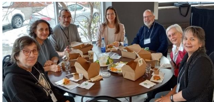
Un agréable moment d’échanges entre les membres, le personnel et la conférencière, croqué sur le vif le 19 novembre 2025.

Huit (8) membres de cinq (5) régions, représentés par douze (12) personnes, y ont participé et ont souligné la pertinence de cette approche pour leur travail quotidien.