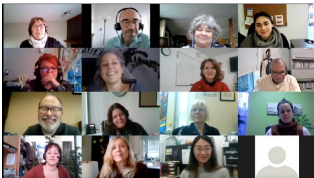
Capture d'écran prise lors de l'assemblée générale annuelle de l'AQCCA, tenue le 15 décembre 2020 via conférence virtuelle ZOOM, où figure une partie des participant(e)s présent(e)s à la rencontre.

Un rendez-vous de fin d'année 2020 réussi!