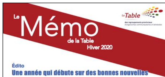
Table des regroupements provinciaux d'organismes communautaires et bénévoles (TRPOCB)

Pour en apprendre davantage sur les dossiers actuels de la TRPOCB, cliquer sur l'image ci-dessus.