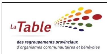
Table des regroupements provinciaux d'organismes communautaires et bénévoles (TRPOCB)

Pour connaître les derniers développements des dossiers en cours, cliquer sur le logo.